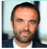
Michaël Delafosse Président de Montpellier Méditerranée Métropole Maire de Montpellier